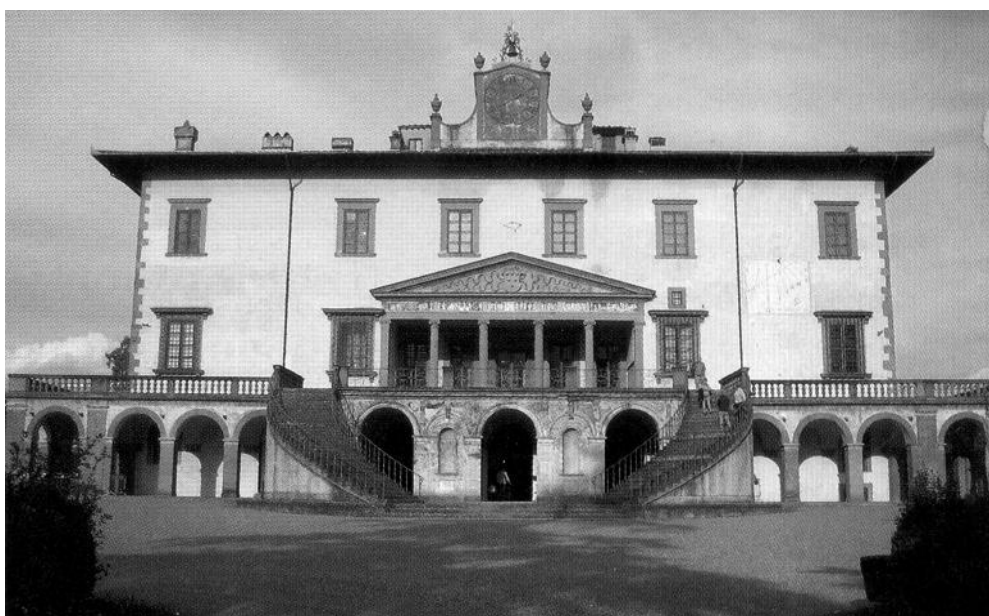
La Villa Medicea di Poggio a Caiano, sede del Museo della Natura Morta

Intensa è stata anche l'attività editoriale che ha visto la banca finanziare una mini collana sulle chiese del comprensorio si-